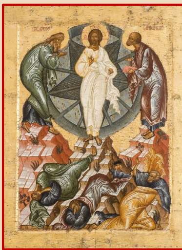
Кирилло-белозерский музей, ок. 1497 г.