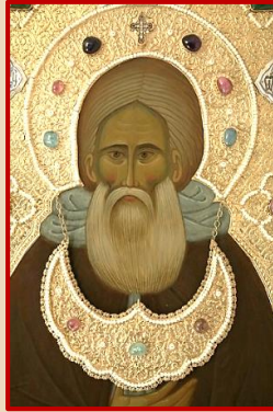
Список с покровы 1-ой чет. XV в. мысли твоим посредничеством.

Преподобне отче, измлада воздержанию прилежав, постивша, орган был еси святаго дъха. Тем и чюдес дарованна прием, человекн научил еси преобидети маловременна. ныне же неизреченным светом светле сиявши, просвети наша мысли ходатайством твоим, мѡдре Сергие.