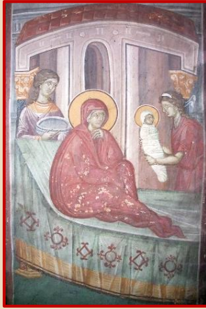
Фреска XIV в. Сербия. Косово. Монастырь Грачаница.

В благознаменитый день праздника нашего вострубим духовною цевницею: Иже ко от семени Давидова, днесь раждается Мати Живота, тьмѹ разрешающа, Адамово оконвление, и Бвнно воззване, и неглениа источник, члн пременение, Бже ради мы ожожихомс и от смерти избавлени быхом, и возопиим Той с Гавриилом, кѣрнии: радуйсѹ, Благодатна, Господь с Тобою, Тебѣ ради дарѹа нам велию милость.